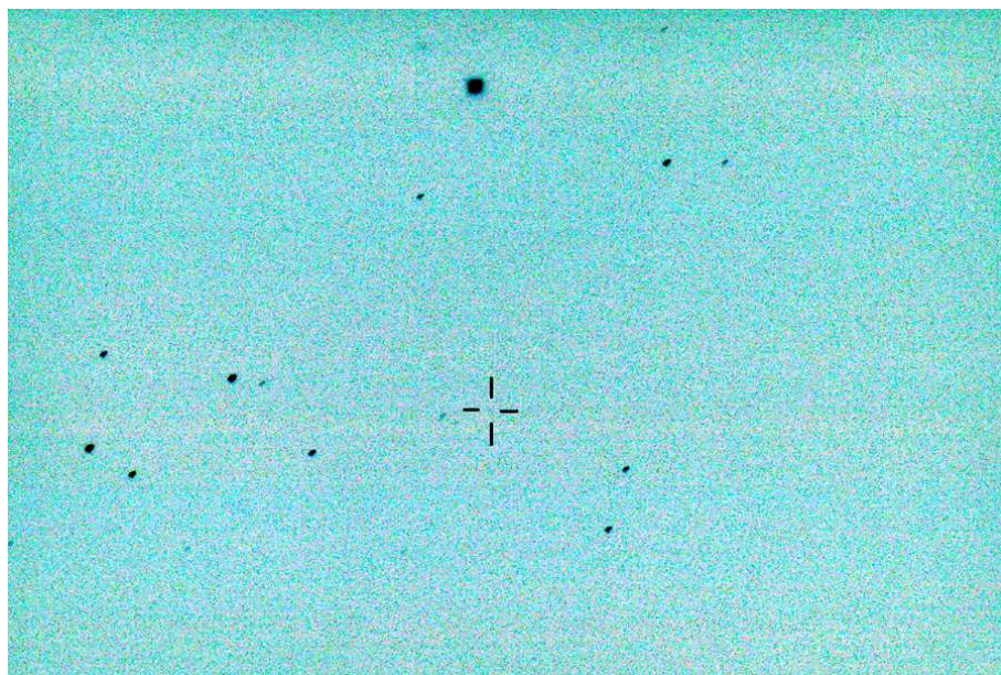
2009年8月23日の小惑星「イナガワ」 猪名川天文台にて撮影

次回の衝は約4年後、2013年9月上旬です。日心距離が今年より小さいので、14等級台まで明るくなるはずです。条件さえよければ、50cm反射望遠鏡で眼視確認できるかも知れません。