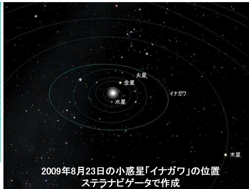
2009年8月23日の小惑星「イナガワ」の位置 ステラナビゲータで作成